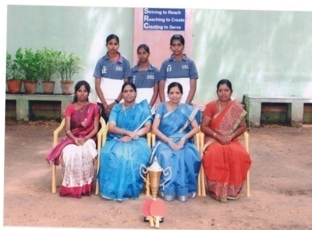
Table Tennis winners in Inter-Collegiate Competition