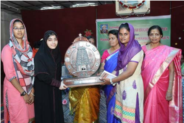
Students of AIMA College received the overall shield for Inter Collegiate Debate