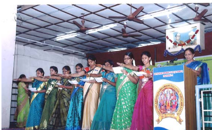
College Union Students are taking Oath

He observed that Seethalakshmi Ramaswami College, a centre for providing culture based education has contributed much to make Trichy an educational hub of Tamil Nadu. Catering to the needs of the rural, first generation learners, it cultivates holistic development of individuals. He advised the students to nurture a quest for knowledge, making good use of information technology sources. He emphasized that being employable is more important than getting degrees. Students, at present must equip themselves with 21 st century skills to be all-rounders. Development of cognitive, affective, psychomotor skills is indispensable in this world of cut-throat competition. College education is just the beginning as people learn to live and live to learn. Quoting from Arnold he advised the students to be more focused, goal-oriented and single-minded in their endeavours.