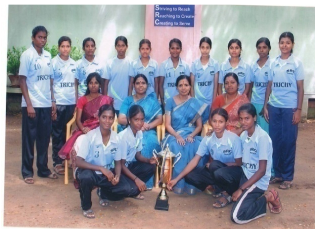
Kho-Kho winners in Inter-Collegiate Competition