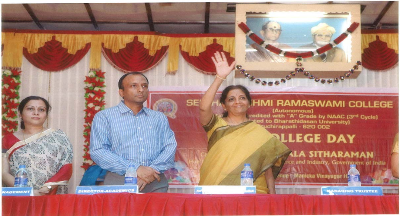
Smt. Nirmala Sitharaman, Honourable Minister of State for Commerce and Industry, Government of India was the Chief Guest on the 65 th College Annual Day (20.02.2016)